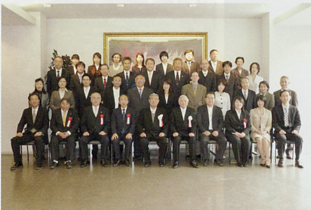
入学式終了後の来賓・教職員との記念撮影の様子