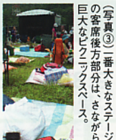
(写真③) 一番大きなステージの客席後方部分は、さながら巨大なビッグボックス。