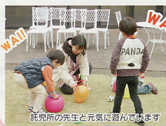
託児所の先生と元気に遊んでいます