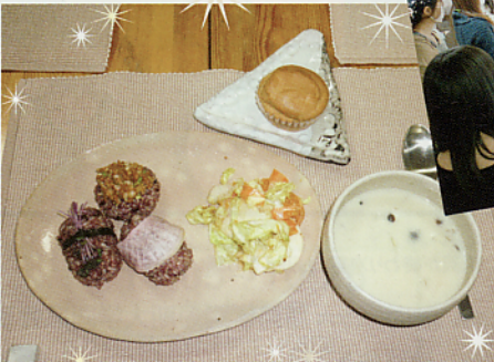
高崎市江木町noonにて