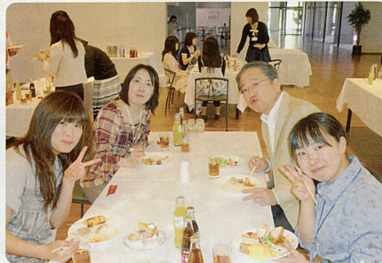
総会後の懇親会の様子