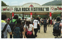
(写真①) 今年のメインゲート

◆①暑さ寒さに対処出来る服装 ②(アウトドア仕様の)レインスーツ上下 ③はき慣れた靴 ④自分の事は自分で、の心構え ⑤何より自然と音楽と隣人愛する心… これ、何の準備だと思いますか? 富士登山…? 惜しいっ、フジ・ロック・フェスティバル(略してFRF)への最低限の持ち物なんです。FRFとは、苗場で夏に行なわれる音楽フェスティバル。所謂「夏フェス」の走りです。苗場スキー場の麓に大小のステージが組みられ、3日間で内外200以上のアーティストが昼夜通してライブを繰り広げる世界に名だたるフェスの1つです。 私は主要なライブを回るのみですが(写真①)、それでも1日12時間は音楽に浸かります。酷暑だろうが豪雨だろうが、ステージ間は徒歩で移動し、心身共にグツタリです(写真②)。でも10年も通っちゃうのは、疲れなんて吹っ飛ばす魅力が詰まってるから。 例えば、