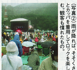
(写真②) 雨が降れば、そそくさとカッパを雨用してロックを楽しむ。観客も慣れたもの。