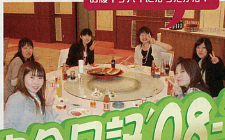
総会終了後の懇親会にて。お腹イッパイになったかな?