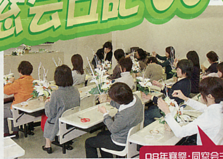
08年襄祭・同窓会主催 フラワーアレンジメント教室