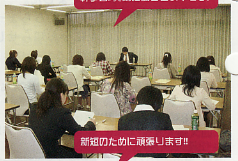
新短のために頑張ります!!