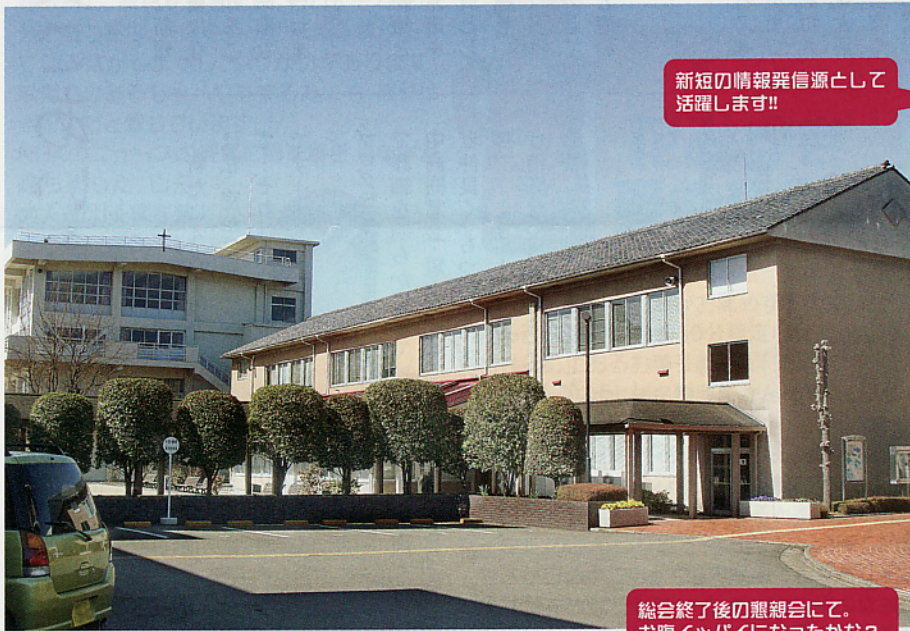
新短の情報発信源として活躍します!!