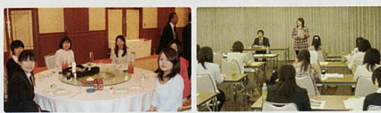
総会後の懇親会の様子