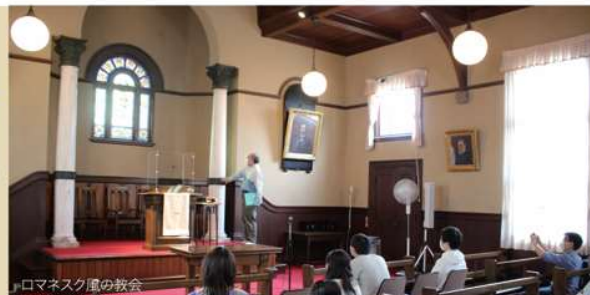
「ロマネスク風の教会」

今回のツアーで印象的だった事は、日本で最古の図書館である便覧舎の存在や安中教会には新島裏のほか、柏木